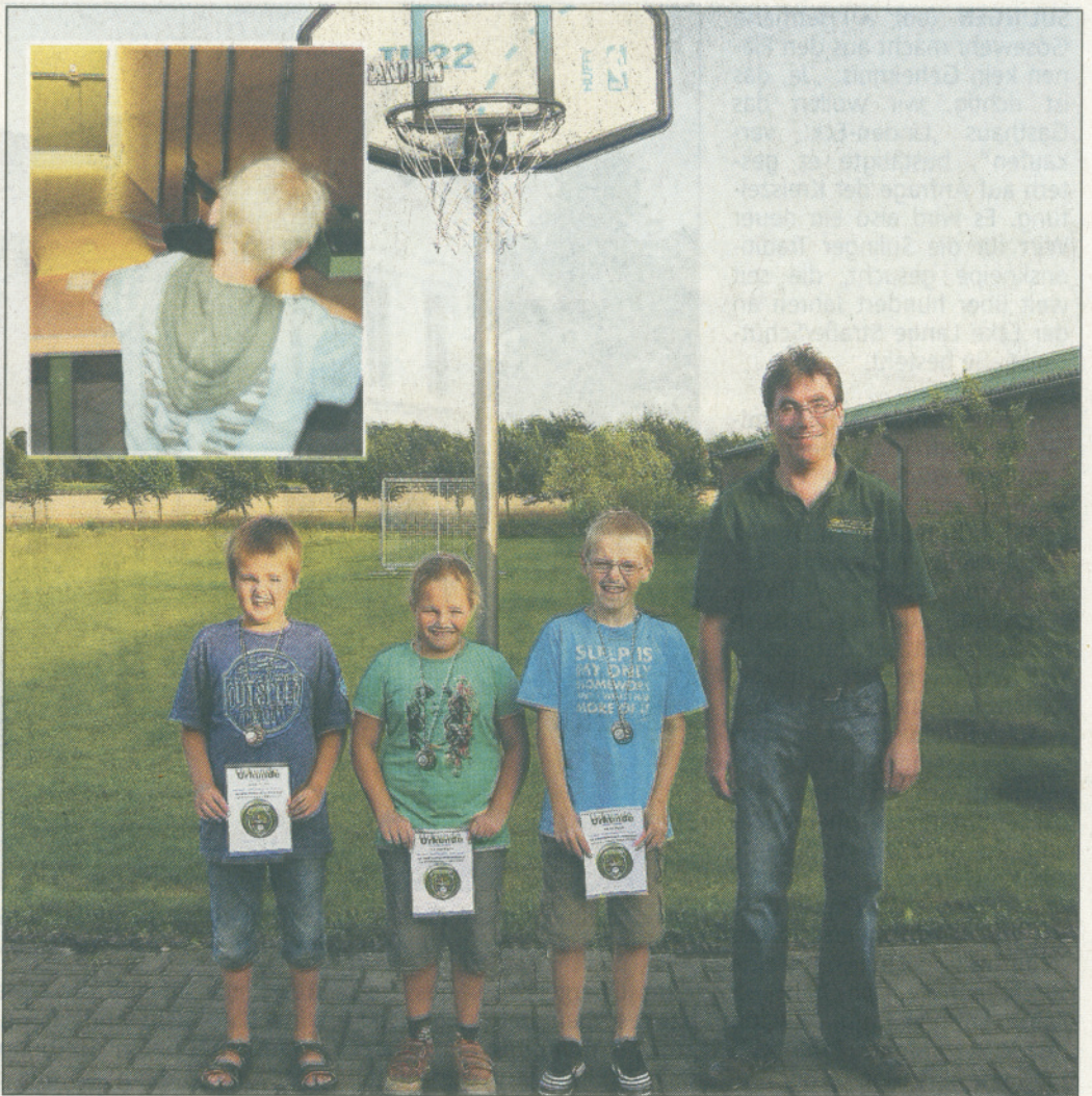
Gr. Foto: Gerd Harzmeier mit den Erstplatzierten. Kl. Foto: Konzentriert zielen ist wichtig.

Kegeln, Basketball und Schießen standen in diesem Jahr auf dem Programm und die Kids hatten damit ihren Spaß. Der Wettergott hatte ein Einsehen und bescherte Organisatoren und Teilneh-